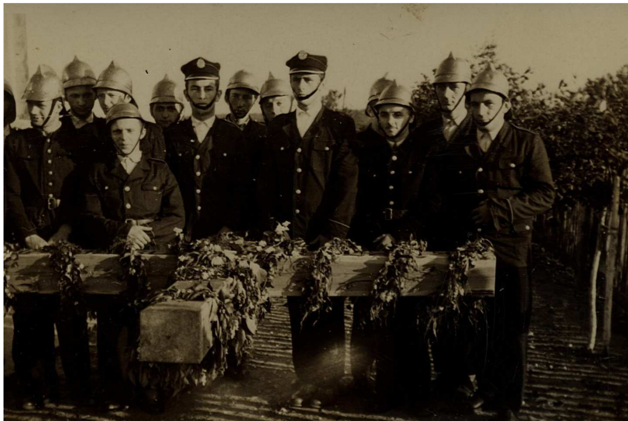
Fot. 13. Rok 1960 strażacy OSP podczas poświęcenia Krzyża Misyjnego.

W październiku 2005 roku jednostka została przekształcona z typu M na S i otrzymała samochód pożarniczy GBAM. Obecnie posiada MDP chłopców i dziewcząt oraz drużynę seniorów OSP. Drużyny te zajmują czołowe miejsc w zawodach gminnych jak również i powiatowych.