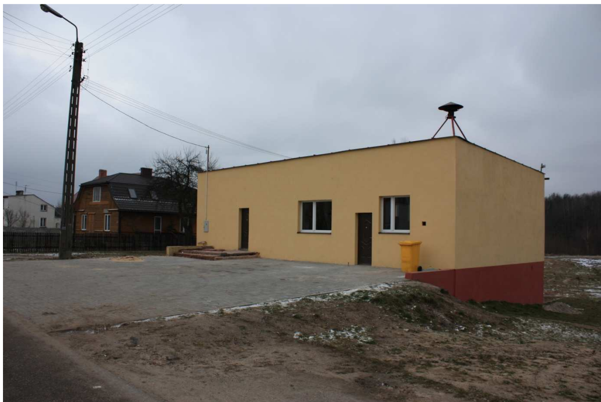
Fot. 11. Strażnica OSP w Mroczkowie.