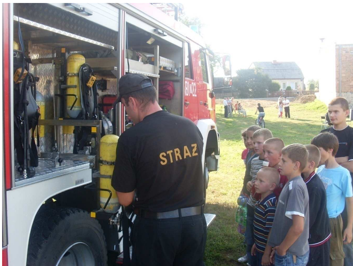
Fot. 18. 19.07.2008. Spotkanie integracyjne w ramach PPWOW