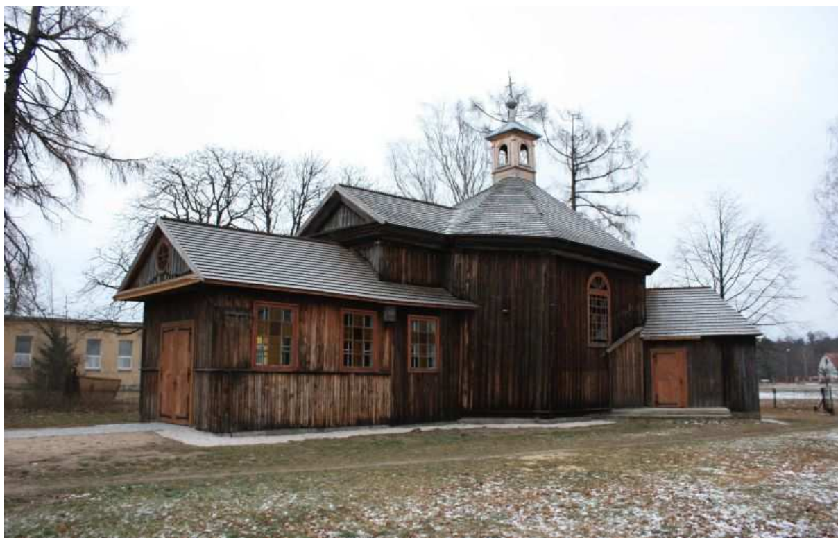
Fot. 7. Kościół św. Rocha w Mroczkowie.