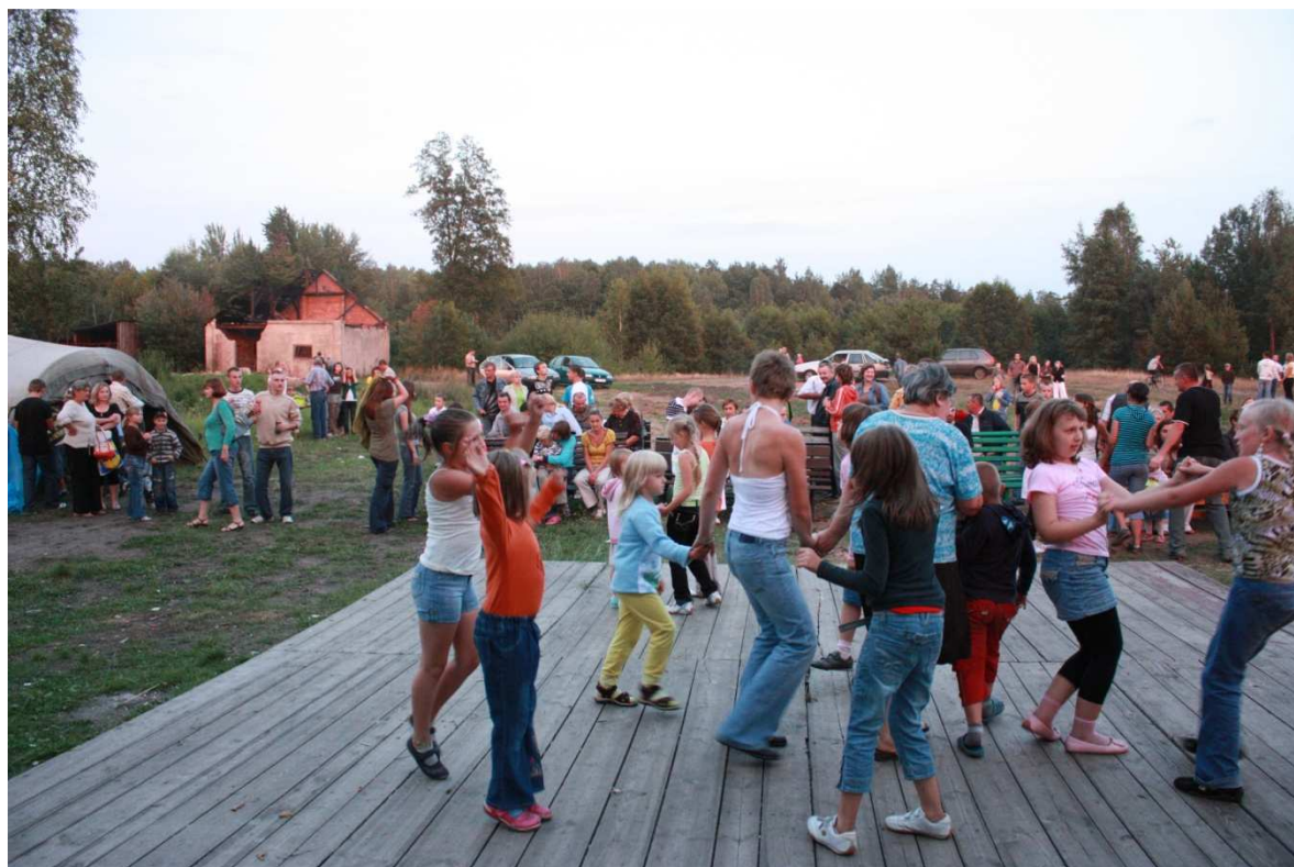
Fot. 17. 23.08.2008. Festyn rodzinny w ramach PPWOW program PIS.