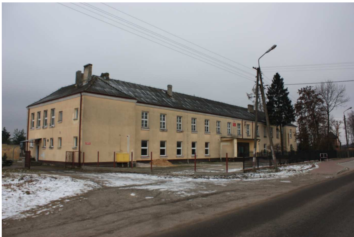
Fot. 9. Szkoła Podstawowa w Mroczkowie.