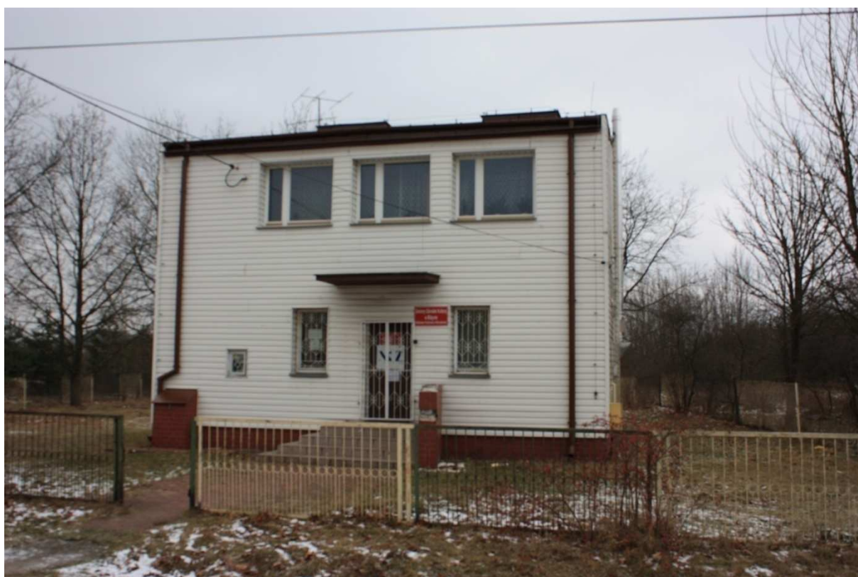
Fot. 10. Biblioteka Publiczna i Punkt Dentystyczny w Mroczkowie.