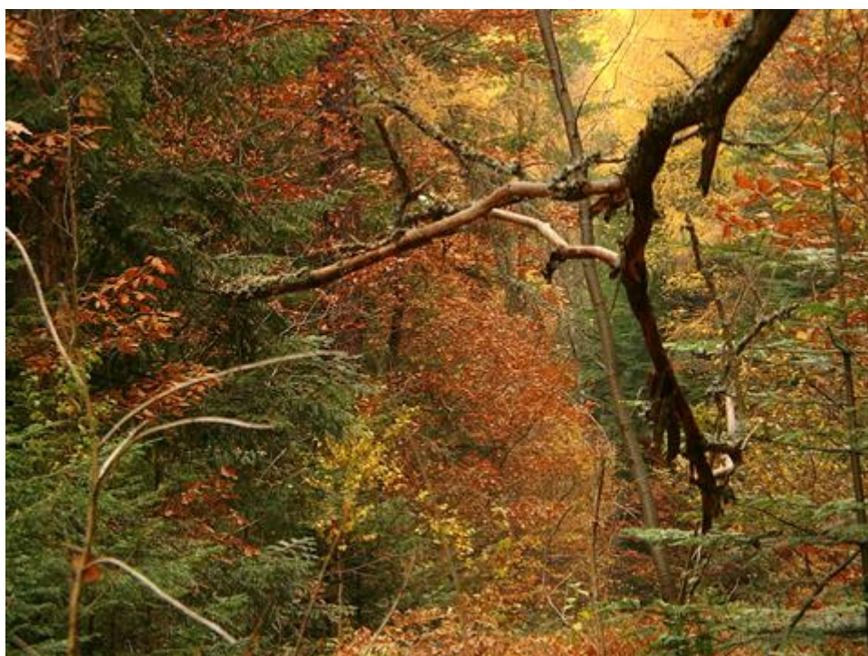
Fot. 6 Jesień w rezerwacie Ciechostowice.

Naturalnym bogactwem miejscowości Mroczków są lasy, które w przeważającej mierze są własnością Skarbu Państwa. Otaczające miejscowość Lasy Państwowe należą do Nadleśnictwa: Skarżysko - Kamienna oraz Stąporków. Dominującymi gatunkami drzew są: sosna (głównie w siedliskach borowych i lasu mieszanego), jodła (w siedliskach lasowych świeżych, wilgotnych), natomiast gatunkami towarzyszącymi są brzoza, osika, dąb, klon, olsza. Osobliwością jest modrzew polski. Rezerwat modrzewiowy „Ciechostowice” - położony jest przy drodze z Mroczkowa, do Ciechostowic na południowo-zachodnim zboczu wzniesienia o wysokości od 345 do 560 m n.p.m. Powierzchnia jego wynosi 7,45 ha