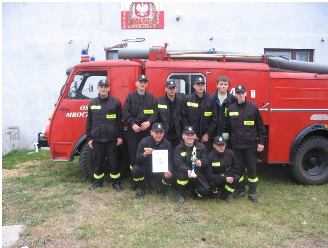
Fot. 16. OSP Mroczków Seniorzy.

Zarząd OSP w Mroczkowie w roku 2008 podjął działania mające na celu modernizację remizy. Zostały wykonane ze środków Urzędu Gminy następujące prace: docieplono budynek i wykonano elewację, ułożono przed budynkiem podjazd z kostki brukowej, wymieniono przyłącze elektryczne. Ponadto Zarząd w ramach Świętokrzyskiego Programu Odnowy Wsi pozyskał dofinansowanie „Remontu Strażnicy Ochotniczej Straży Pożarnej w Mroczkowie”. Dofinansowanie projektu wyniosło 20.000 zł co stanowiło 80% wartości kosztów. Wkład własny OSP Mroczków wyniósł 5.000 zł. W ramach projektu zostały kompleksowo wyremontowane pomieszczenia w strażnicy.