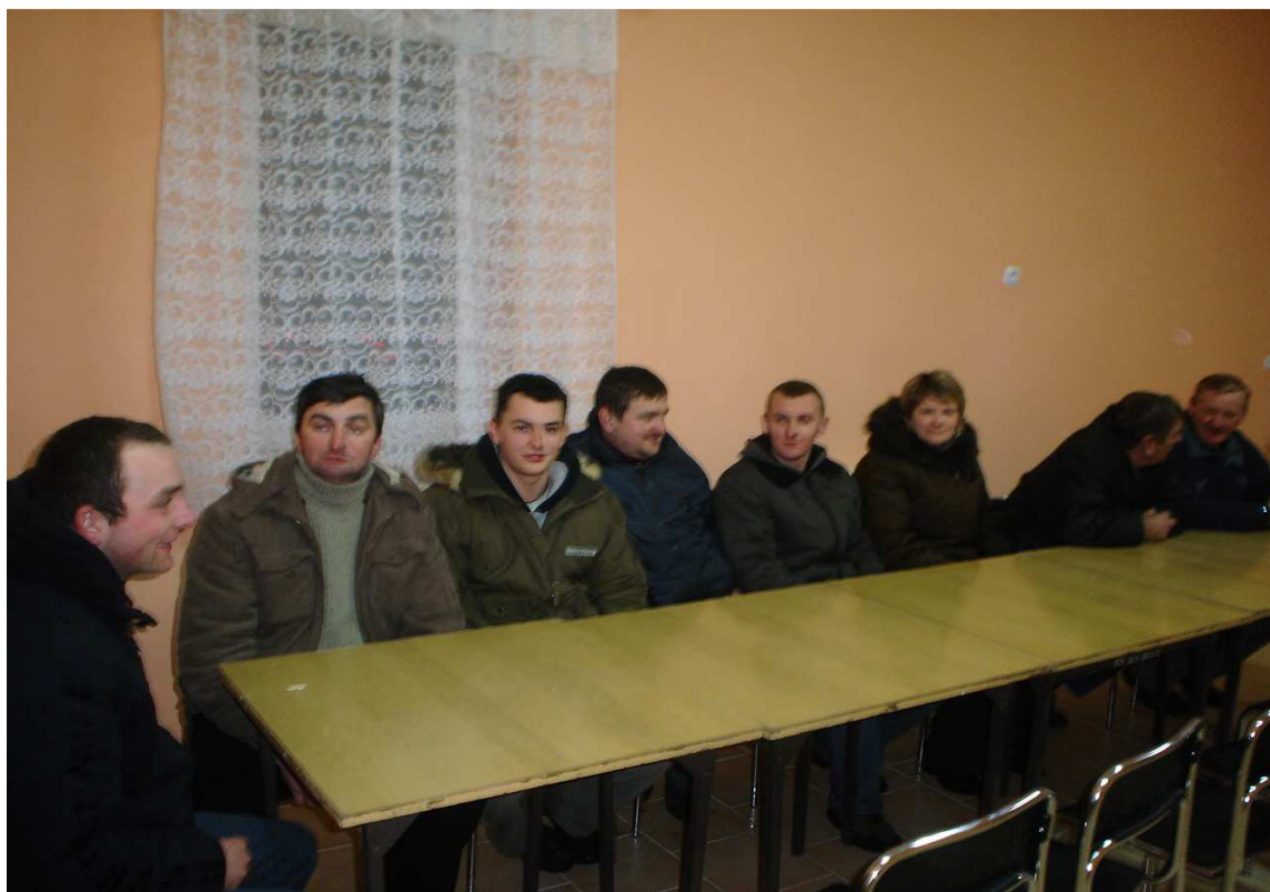
Fot. 2. Zebranie wiejskie w dniu 08.01.2009.