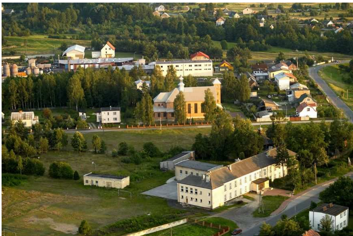
Fot. 4. Mroczków – widok z powietrza. Foto Krzysztof Ptak. www.blizyn.pl