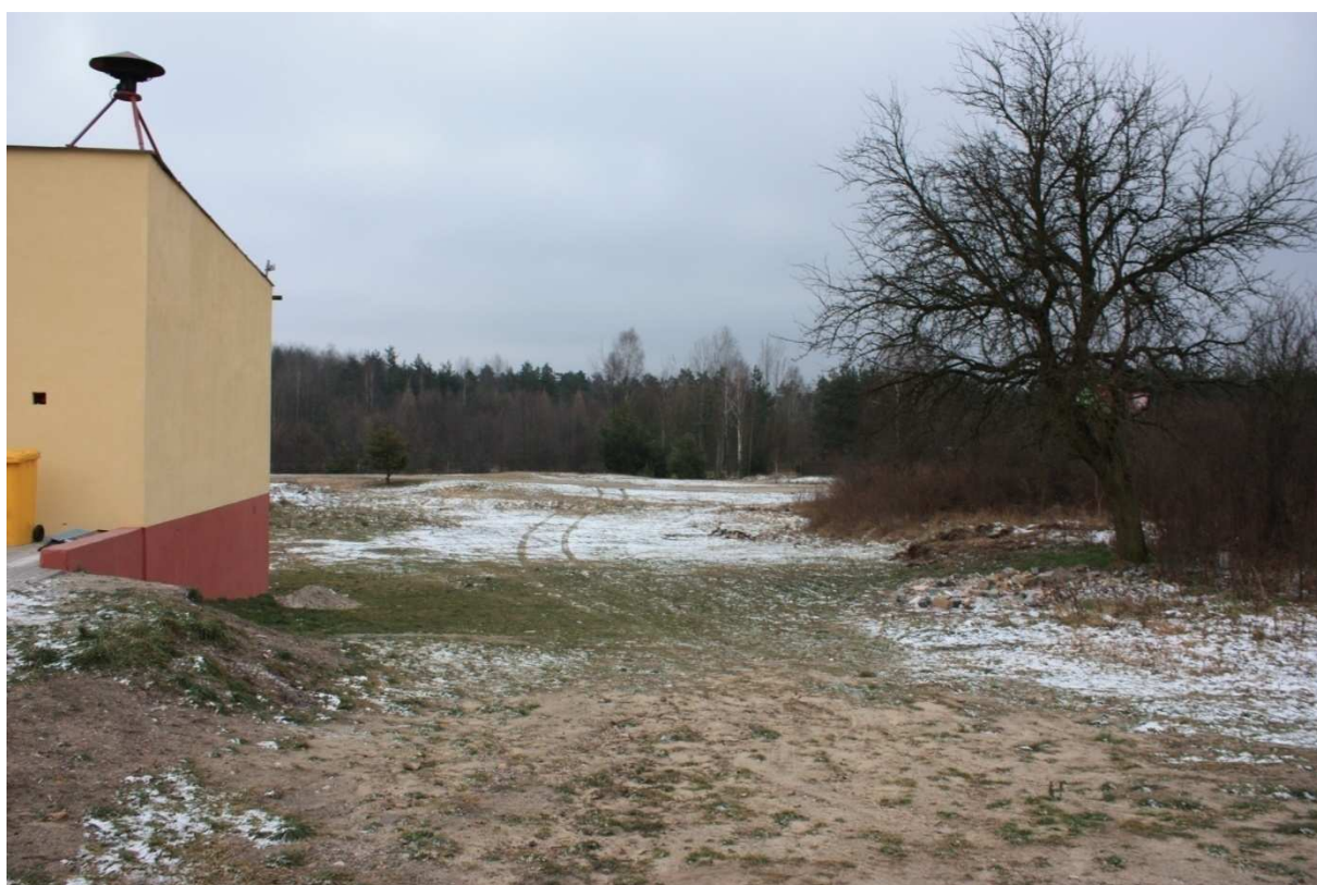
Fot. 21. Teren obok OSP do zagospodarowania i pod budowę miejsca integracji społecznej.