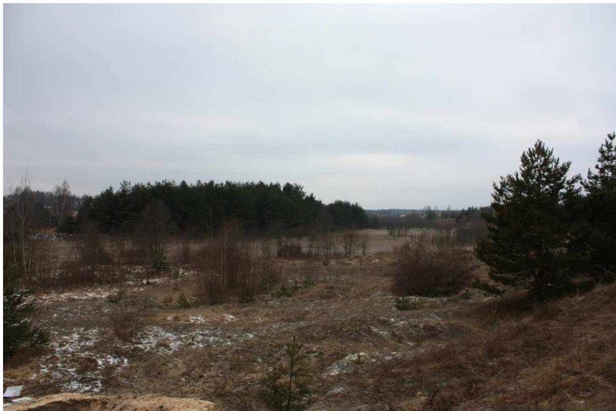
Fot.20. Miejsce pod budowę zbiornika wodnego. W miejscu tym istniał Staw Stary Piecowy zaopatrujący w wodę wielki piec.