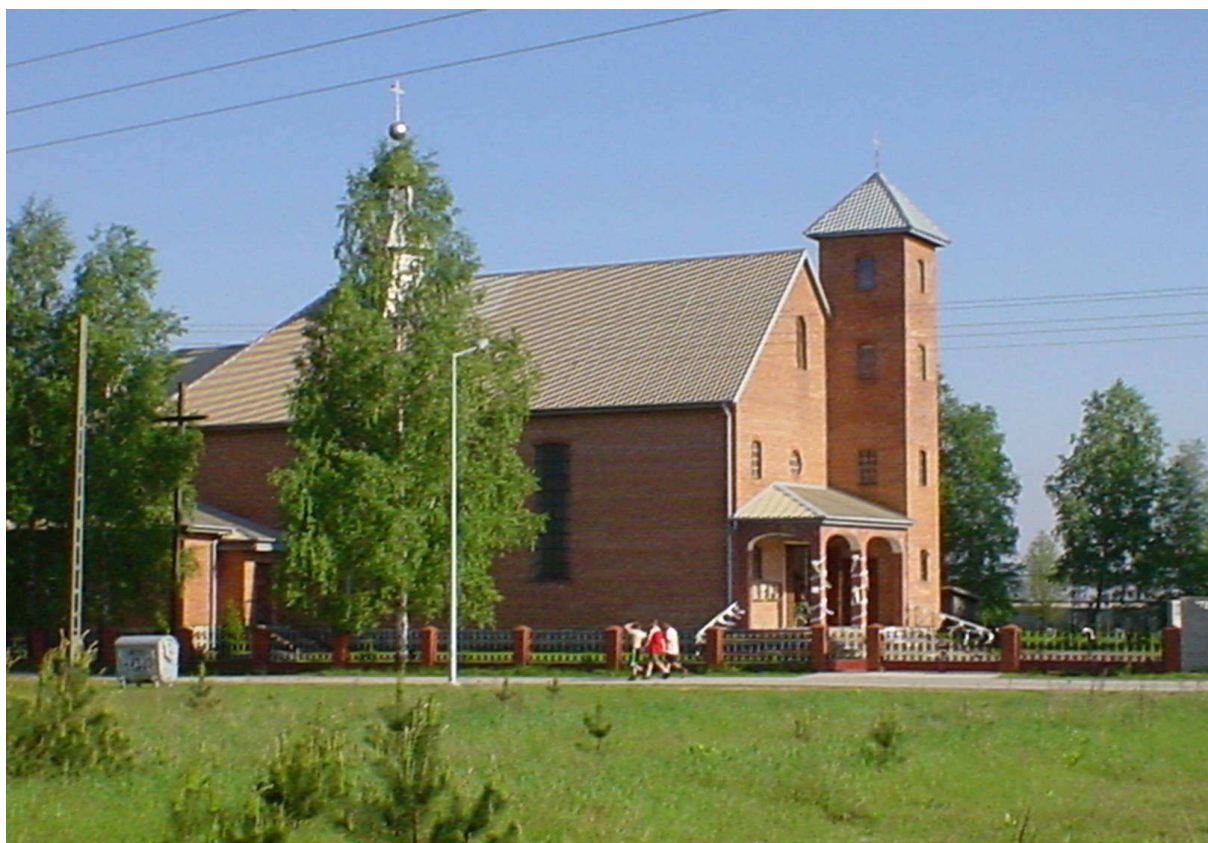
Fot. 8. Kościół pw. Matki Bożej Nieustającej Pomocy.