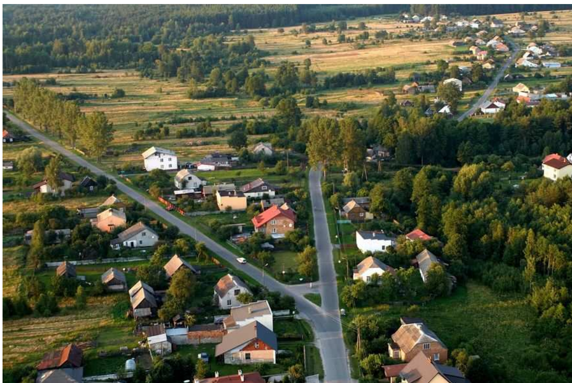
Fot. 5. Mroczków – widok z powietrza.