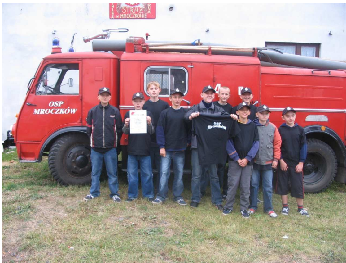
Fot. 15. Młodzieżowa Drużyna Pożarnicza Chłopców.