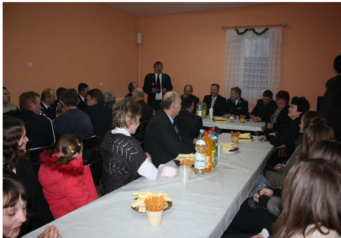
Fot. 3. Zebranie wiejskie w dniu 17.01.2009.