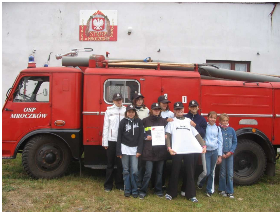
Fot. 14. Młodzieżowa Drużyna Pożarnicza Dziewcząt.