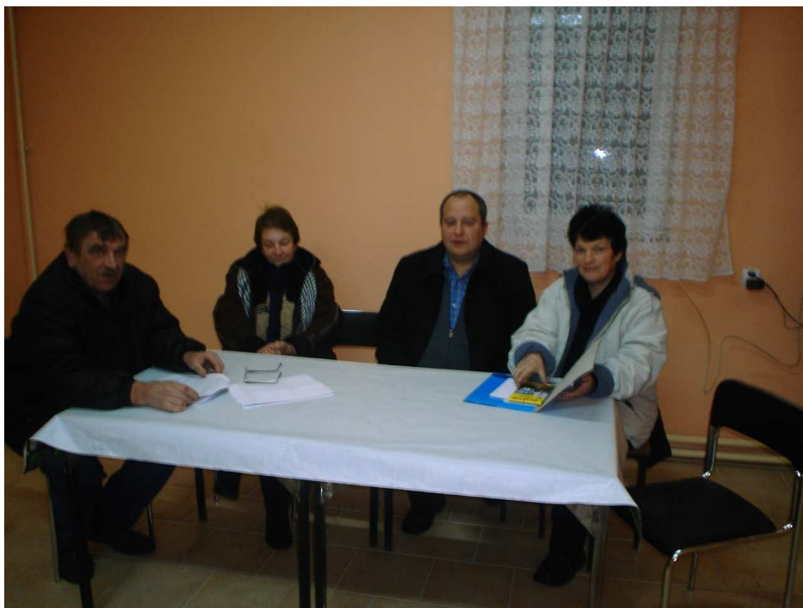
Fot. 1. Zebranie wiejskie w dniu 08.01.2009.

Plan Odnowy Miejscowości przedstawia sytuację społeczno-gospodarczą miejscowości Mroczków, formułuje problemy, zadania i projekty, których realizacja pozwoli osiągnąć oczekiwany poziom rozwoju. Jest narzędziem umożliwiającym podejmowanie efektywnych decyzji finansowych związanych z angażowaniem środków własnych gminy jak i ubieganiem się o środki ze źródeł zewnętrznych. Przygotowanie Planu Odnowy Miejscowości poprzedził proces konsultacji społecznych. Projekt był omawiany na zebraniu strategicznym Zespołu ds. Planu Odnowy Miejscowości Mroczków (08 stycznia 2009r.) oraz podczas Zebrania Wiejskiego ( 17 stycznia 2009r.)