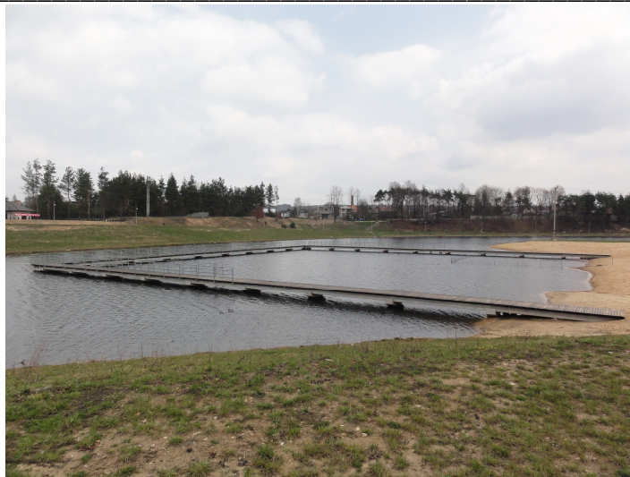
Kąpielisko z pomostem