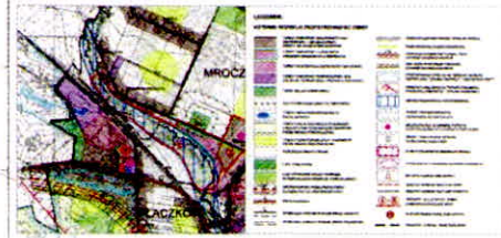
WYRYS ZE STUDIUM... W SKALI 1 : 20 000