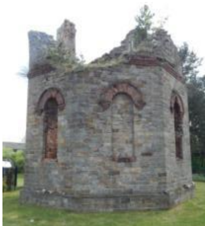
Fragment wieży ciśnieniowej ul. Rudowskiego w Bliżynie

Bogatą historię kultury technicznej regionu dokumentują dziś nieliczne zabytki w Bliżynie i w Sołtykowie.