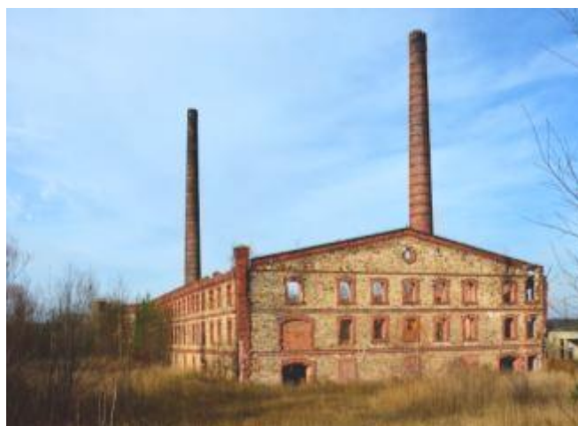
Ruiny cegielni w Sołtykowie

W roku 1928, ze względu na walory klimatyczne okolic, opracowano projekt luksusowego Uzdrowiska Sportowo-Klimatycznego, w którym przewidziano budowę obiektów do uprawiania większości ówczesnych dyscyplin olimpijskich. Planów tych nie zdążono zrealizować.