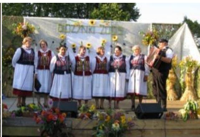
Zespół Ludowy "Kuźniczanki"

W gminie działa Koło Gospodyń Wiejskich w Sorbinie, które skupia kobiety kultywujące zwyczaje kulinarne i obrzędowość związaną ze świętami kościelnymi.