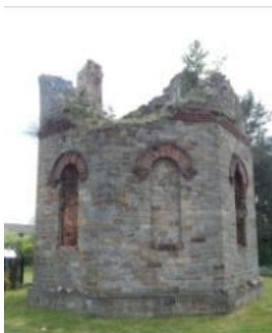
Pozostałości odlewni żeliwa „Ludwików”

W tym czasie na terenie gminy Bliżyn rozwinęło się szkolnictwo powszechne oraz spółdzielczość, powstała ochotnicza straż pożarna i pierwsza apteka. Działają ponadto: Zakłady Górnicze, kopalnie rudy „Skały” i „Piekło”, tartaki drzewne Podkańskiego i Rozemberga w Wojtynowie, fryszerka w Płaczkowie, cegielnia w Sołtykowie, wyrób kół w Kucębowie, wypalanie węgla drzewnego i pędzenie smoły w Kopciach i Szałasie, młyny wodne.