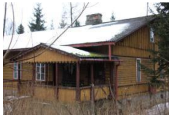
Dom urzędniczy w zespole osiedla Odlewni Żeliwa, ul. Kościuszki 95 w Bliżynie