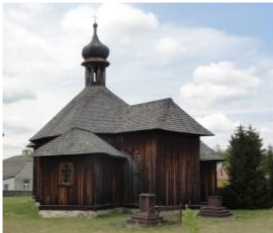
KOŚCIÓŁ FILIALNY PW. ŚW. ZOFII w zespole kościoła fil. p.w. św. Zofii w Bliżynie