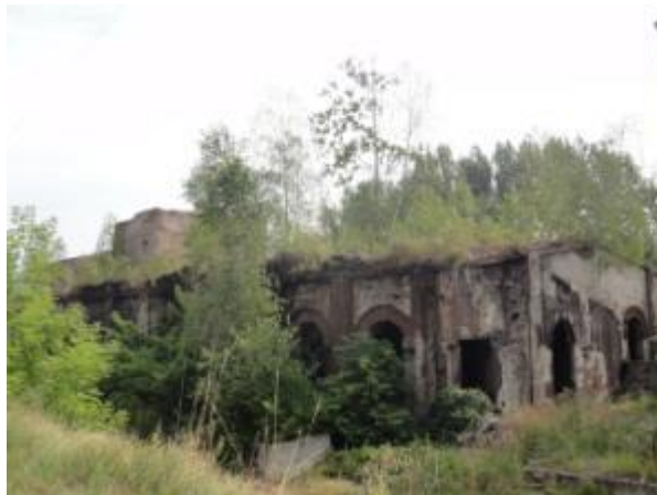
Pozostałości odlewni żeliwa ul. Staszica w Bliżynie