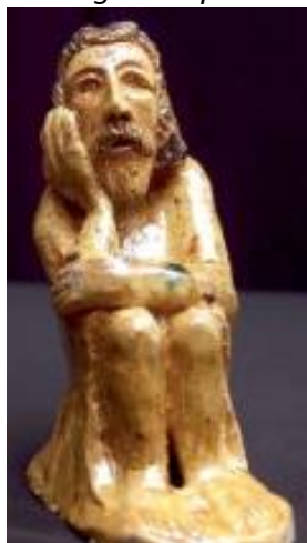
Drewniana rzeźba ludowa Władysława Berusa