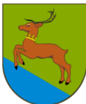
Herb Gminy Bliżyn