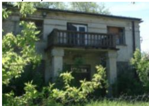
Stajnia w zespole Pałacyku Platerów

Bogatą historię kultury technicznej regionu dokumentują dziś nieliczne zabytki w Bliżynie i w Sołtykowie.