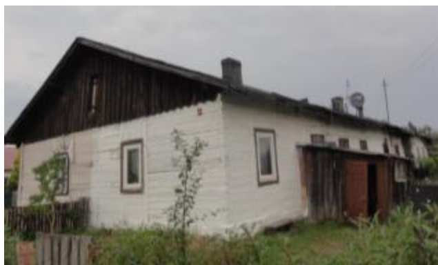
Dom robotniczy w zespole osiedla Odlewni Żeliwa, ul. Kościuszki 144 w Bliżynie

Zabudowa mieszkalna powinna być objęta ochroną jako dziedzictwo kulturowe Staropolskiego Okręgu Przemysłowego. W rejonie zachowały się obiekty SOP: fabryki, odlewnie, kuźnice, walcownie, urządzenia wodne, itp. Często są to obiekty w ruinie, nieużytkowane. Nie zachowały się natomiast zespoły zabudowy mieszkalnej i usługowej o charakterze wiejskim tego Okręgu.