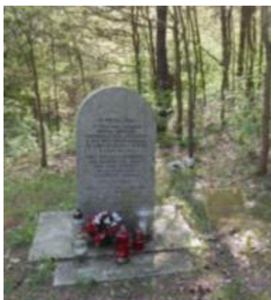
Pomnik upamiętniający śmierć więźniów obozu koncentracyjnego w Bliżynie