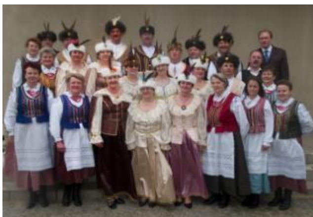
Zespół Pieśni i Tańca "Sorbin"

Zespoły muzyczne: Zespół Ludowy "Sobótka", Zespół Ludowy "Kuźniczanki" oraz Zespół Pieśni i Tańca "Sorbin" mają w repertuarze piosenki związane z regionem świętokrzyskim, kolędy i pastorałki oraz pieśni patriotyczne. Największym sukcesem Zespołu Ludowego "Sobótka" jest przedstawienie obrzędu „Wesela Świętokrzyskiego” wzorowanego na opracowaniu Stanisława Suchorowskiego.