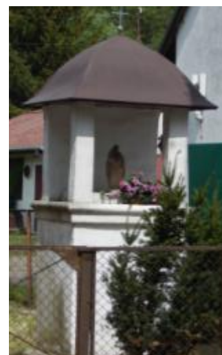
Kapliczka Matki Boskiej w Bliżynie