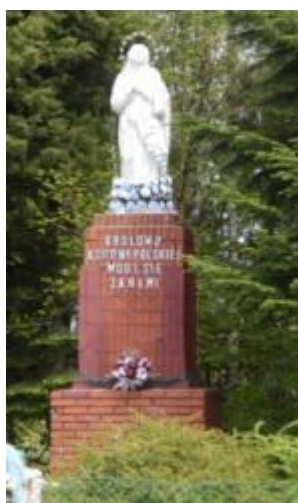
Współczesna figura Matki Boskiej w Piętach