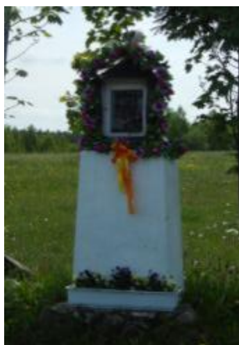
Kapliczka w Kucębowie