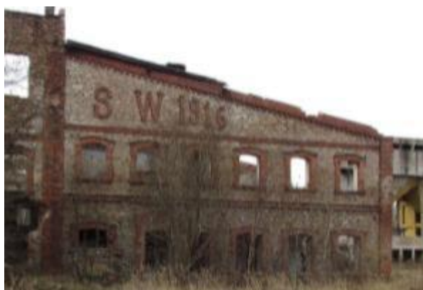
Ruina cegielni w Sołtykowie