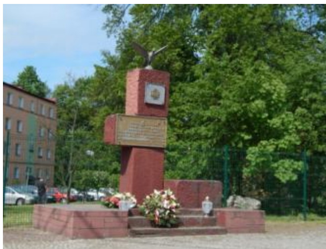
Pomnik ofiar II wojny światowej w Bliżynie

Częstym elementem krajobrazu gminy Bliżyn są kapliczki i krzyże przydrożne, o które dbają mieszkańcy poszczególnych miejscowości.