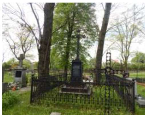
Nagrobki na "starym cmentarzu w Bliżynie

Zabytkowe nagrobki, zachowujące walory artystyczne znajdują się przede wszystkim na "starym cmentarzu" i cmentarzu przy kościele p.w. św. Zofii w Bliżynie. Nagrobki pochodzą z XIX w. i początku XX w. Najczęstszą formą są nagrobki w stylu neogotyckim, m.in.: na ośmiobocznej podstawie i zwieńczone krzyżem, różnego typu krucyfiksy na kamiennej podstawie, tablice oraz obramowania grobów. Często są elementy żeliwne (krzyże, obramowania grobów) lub całe żeliwne nagrobki - np. w formie pnia drzewa. Na innych pozostałych cmentarzach wymieszane są nagrobki stare (z początku XX w.) i nowe (współczesne), wśród których znajdują się liczne nagrobki będące także Miejscami Pamięci Narodowej.