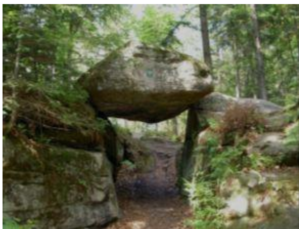
Brama piekielna w rezerwacie Świnia Góra