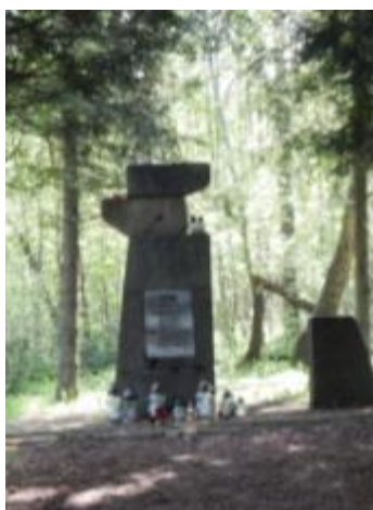
Cmentarz radzieckich jeńców wojennych 1941-1943 w Wojtyniowie

Na terenie gminy Bliżyn ważne dla regionu wydarzenia historyczne upamiętnione są pomnikami. Najczęściej Miejsca Pamięci Narodowej upamiętniają okres II wojny światowej, ważne bitwy tego czasu, ofiary obozu koncentracyjnego, itp. Ponadto na cmentarzach katolickich w gminie znajdują się liczne nagrobki - miejsca pochówku ofiar wojen.