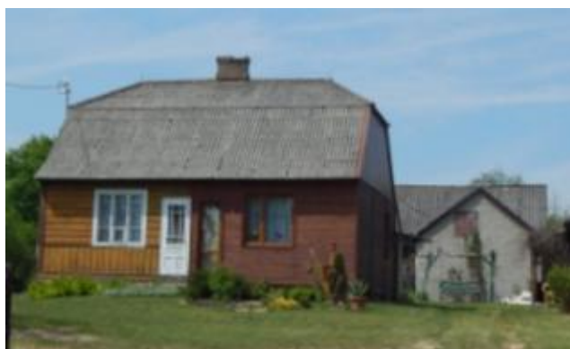
Dom drewniany z zagrodą w Nowkach