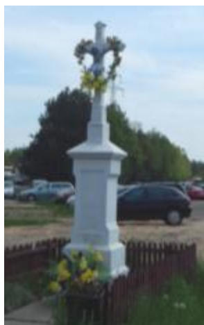
Krzyż kamienny z 1877 roku w Mroczkowie