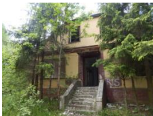
Budynek zarządu cegielni w Sołtykowie

Obiekty te są w ruinie, wymagają zabezpieczenia i ochrony, ponieważ stanowią znikomą część dawnych założeń fabrycznych. Najwłaściwszą formą ochrony powinno być zabezpieczenie tych relikwów przed zniszczeniem oraz wandalizmem w otoczeniu ich naturalnego zaplecza