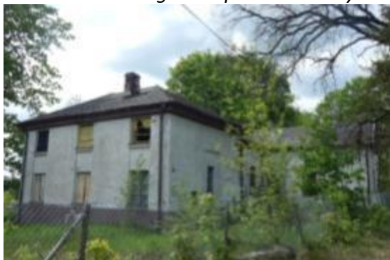
Oficyna w zespole Pałacyku Platerów