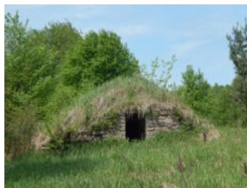
Piwniczka w Nowkach

Zagrożeniem dla tradycyjnego krajobrazu oraz utrzymania lokalnego charakteru miejscowej architektury i budownictwa jest potrzeba dostosowania budownictwa mieszkalnego do obecnych norm i potrzeb. Domy mieszkalne tracą swój charakter po przebudowie, rozbudowie, modernizacji, np. nadbudowy (zniekształcanie formy architektonicznej), wymiana okien (likwidacja detali architektonicznych), montaż nowoczesnych urządzeń, itp. Liczne szkody w tradycyjnej zabudowie przyniosło również zaprzestanie użytkowania, a co za tym idzie niszczenie obiektów. Nie zachowały - niegdyś bardzo liczne, związane ze Staropolskim Okręgiem Przemysłowym - się np. budowle kuźnic, młynów wodnych, mniejszych zakładów