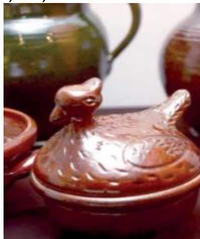
Ceramika Jarosława Rodaka