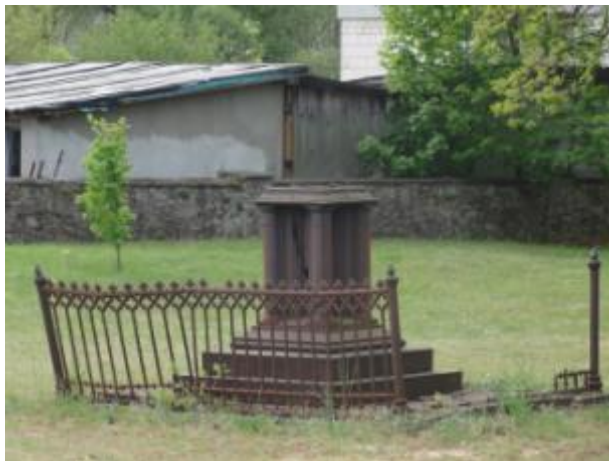
CMENTARZ DWORSKI PRZY KOŚCIELE w zespole kościół fil. p.w. św. Zofii w Bliżynie

Kaplica orientowana, ma plan wydłużonego ośmioboku. Od zachodu ma prostokątną przybudówkę, która pełni rolę kruchty. Od wschodu są trzy przybudówki, które pełnią funkcję zakrystii i kaplicy (umieszczone skośnie do osi) i prezbiterium (na osi głównej).