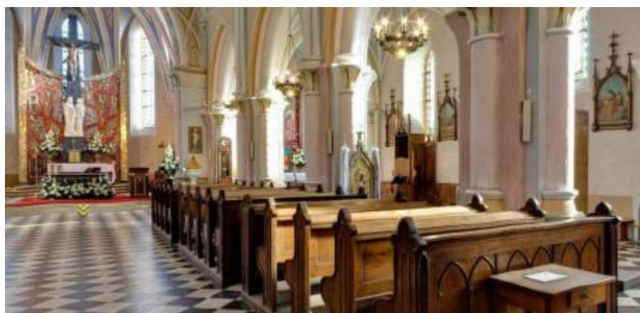
Wnętrze kościoła p.w. św. Ludwika w Bliżynie

Wśród zabytków ruchomych na terenie gminy znajdują się obiekty stanowiące wyposażenie kościołów: Bliżyn - p.w. św. Ludwika i p.w. św. Zofii, Mroczków - p.w. św. Rocha, częściowo przeniesione do kościoła p.w. Matki Boskiej Nieustającej Pomocy.