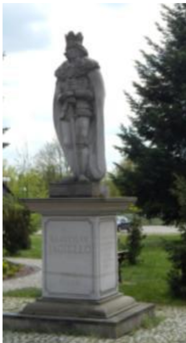
Pomnik Władysława Jagiełły w Bliżynie 1

Najstarsza datowana wiadomość o Bliżynie pochodzi z zapisu Jana Długosza w diariuszu podróży króla Władysława Jagiełły z Krakowa pod Grunwald w 1410 roku. Król nocował w Bliżynie z 21 na 22 czerwca 1410 r. prawdopodobnie u swojego dworzanina Piotra Szafrąca z Pieskowej Skąły.