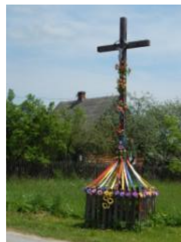
Krzyż drewniany w Nowkach