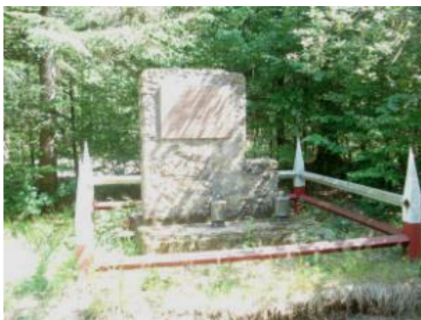
Miejsce bitwy oddziału mjr Hubala „Rogowy słup” w rejonie rezerwatu Świnia Góra