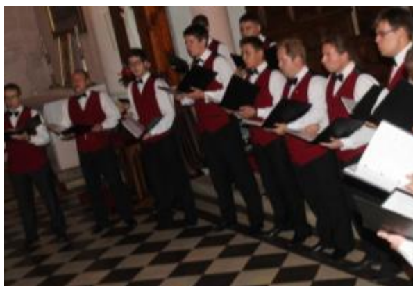
Koncert muzyki organowej i kameralnej