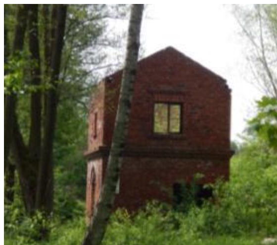
Młyn wodny w Gilowie