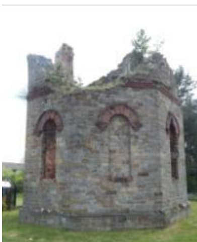
Pozostałości odlewni żeliwa „Ludwików”