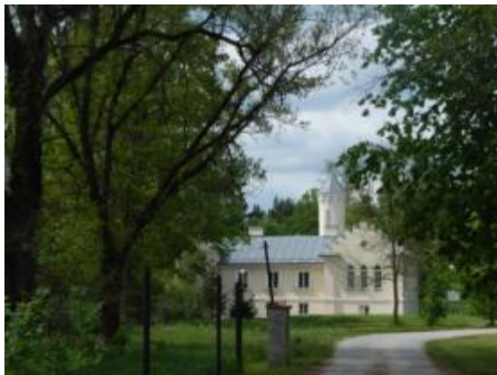
PARK w zespole Pałacyku Platerów w Bliżynie

Pozostałość dawnego założenia pałacowego - oficyna - wykonany w stylu neogotyckim. Leżący nieopodal klasycystyczny pałac z końca XVIII w. został zniszczony w 1 ćw. XX w., a jego reszta została przebudowana. W czasie II wojny światowej obiekt służył Niemcom jako komendantura obozu pracy i obozu koncentracyjnego - "filia Majdanka".