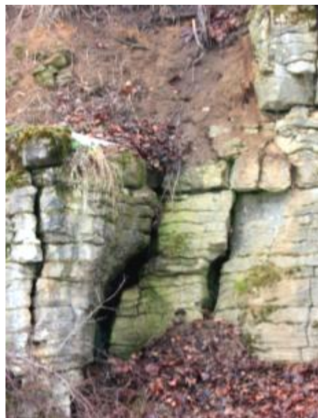
Kamieniołom w Gostkowie

Ponadto w gminie znajduje się kamieniołom w Gostkowie, składający się z 3 dużych, i kilku małych wyrobisk. W środkowym wyrobisku można na jednej ze ścian rozpoznać ślady po kominie krasowym; czyli pionowym lub bardzo stromym, biegnącym w górę odcinku jaskini, o zamkniętym przekroju, bez możliwości dalszego przejścia. W obrębie kamieniołomu (prawdopodobnie w najbardziej na zachód wysuniętym wyrobisku) leży niedostępna już dziś jaskinia.