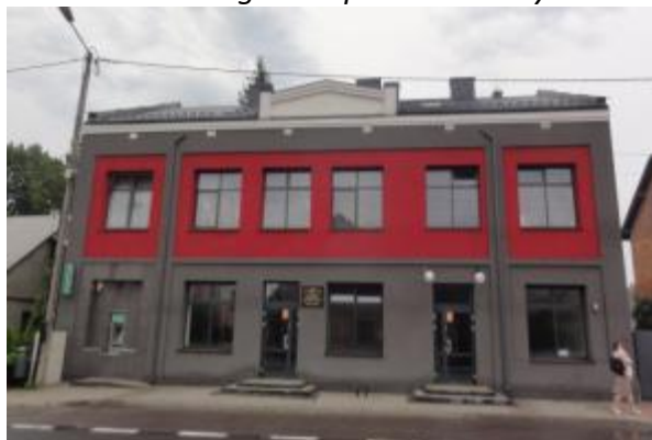
Dom ludowy stowarzyszenia kupców, ob. dom handlowy ul. Kościuszki w Bliżynie