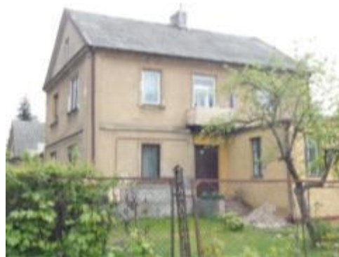
Zespół Nadleśnictwa., ul. Kościuszki 81 w Bliżynie

Zabytkowe nagrobki, zachowujące walory artystyczne znajdują się przede wszystkim na "starym cmentarzu" i cmentarzu przy kościele p.w. św. Zofii w Bliżynie. Nagrobki pochodzą z XIX w. i początku XX w. Najczęstszą formą są nagrobki w stylu neogotyckim, m.in.: na ośmiobocznej podstawie i zwieńczone krzyżem, różnego typu krucyfiksy na kamiennej podstawie, tablice oraz obramowania grobów. Często są elementy żeliwne (krzyże, obramowania grobów) lub całe żeliwne nagrobki - np. w formie pnia drzewa. Na innych pozostałych cmentarzach wymieszane są nagrobki stare (z początku XX w.) i nowe (współczesne), wśród których znajdują się liczne nagrobki będące także Miejscami Pamięci Narodowej.