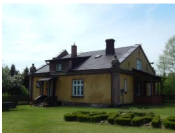
Leśniczówka w Szałasie

W miejscowościach spotyka się obiekty dawnej zabudowy wsi, głównie domy mieszkalne, ale też pojedyncze obiekty gospodarskie np. stodoły czy piwniczki ziemne, obiekty związane z działalnością okołorolniczą np. młyn. Są to obiekty będące własnością prywatną, w różnym stanie technicznym.