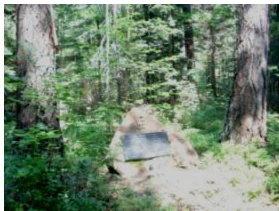
Głaz pamięci oddziałów partyzanckich "Nurta" w rejonie rezerwatu Dalejów