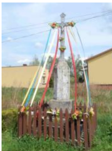
Krzyż kamienny z 1902 roku w Ubyszowie