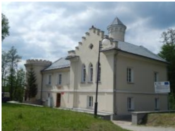
ZAMECZEK NEOGOTYCKI w zespole Pałacyku Platerów wraz z terenem w granicach działki nr 872/6 w Bliżynie