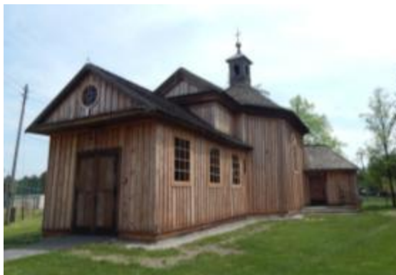
KOŚCIÓŁ PARAFIALNY PW. ŚW. ROCHA w zespole kościoła par. pw. św. Rocha w Mroczkowie

Według podań kościół zbudowany na grobach zmarłych na przełomie XVI/XVII wieku jako wotum za ustanie zarazy. Na terenie znajduje się modrzewiowy kościół św. Rocha i drewniana dzwonnica.