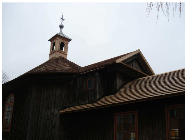
Kościółek św. Zofii w Bliżynie foto: M.Walachnia. Kościół św. Rocha w Mroczkowie