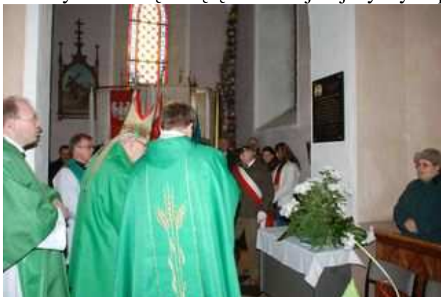
Odświeżenie pamiątkowej tablicy