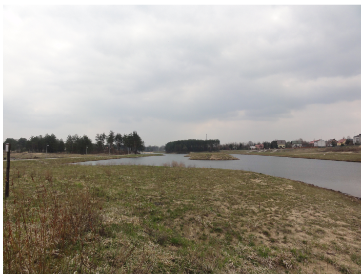
Odbudowany zalew Bliżyński na rzece Kamiennej

Odbudowane urządzenia piętrzące stworzyły warunki do wytworzenia retencji powodziowej forsowanej w ilości 90 tys. m 3 , uchronią mieszkańców przed skutkami powodzi oraz zapobiegną zalaniu gruntów wzdłuż rzeki Kamiennej.