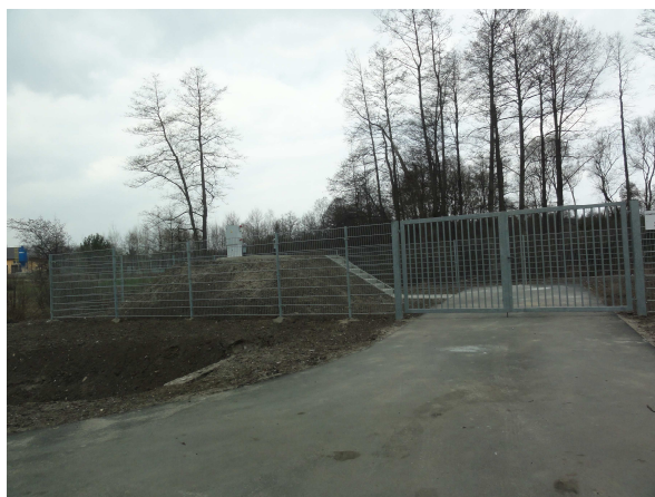
Wybudowana mechaniczno-biologiczna oczyszczalnia ścieków i przepompownia w miejscowości Wojtyniów