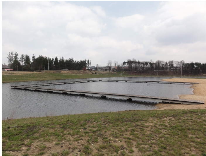
Kąpielisko z pomostem