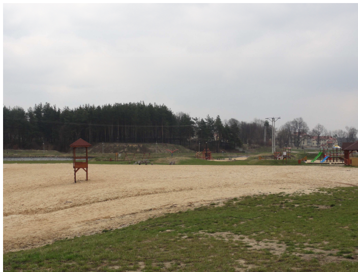
Plaża z placem zabaw przy kąpielisku