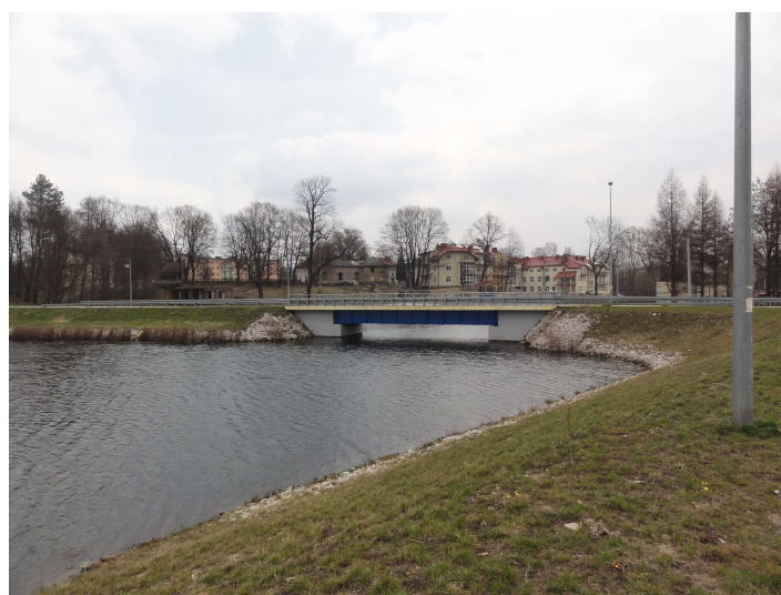
Przebudowany most kolejowy