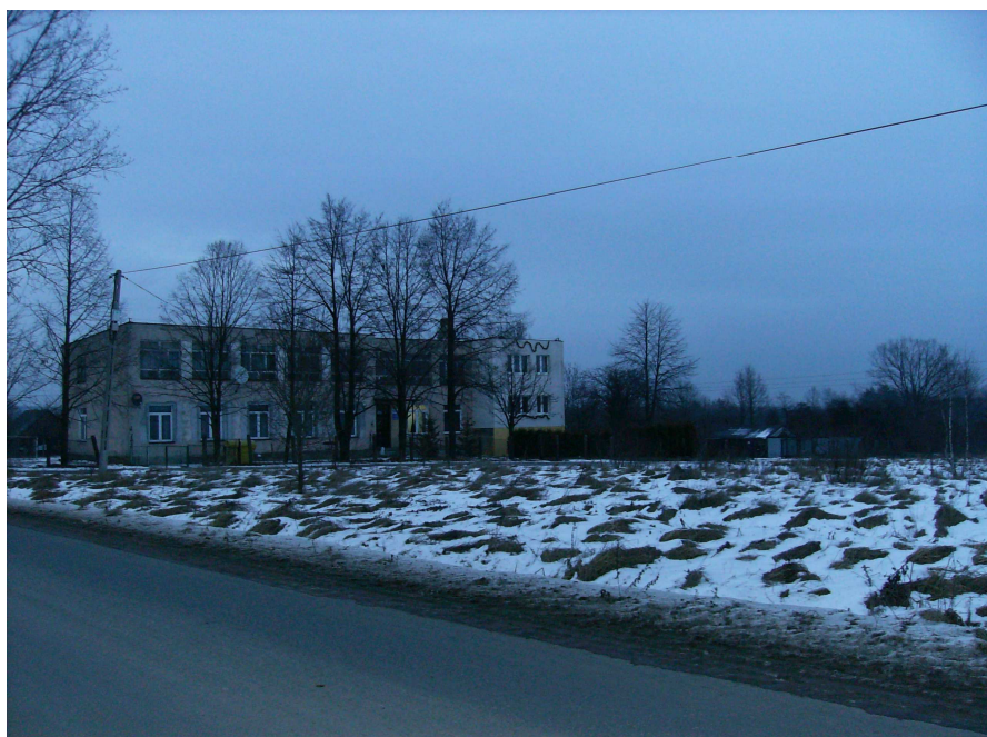
Zdjęcie nr 13. Budynek po byłej szkole podstawowej w Ubyszowie

Budynek ten został wzniesiony przy 30% wkładzie udziału mieszkańców w postaci oddanych gruntów, składek pieniężnych i czynów społecznych.