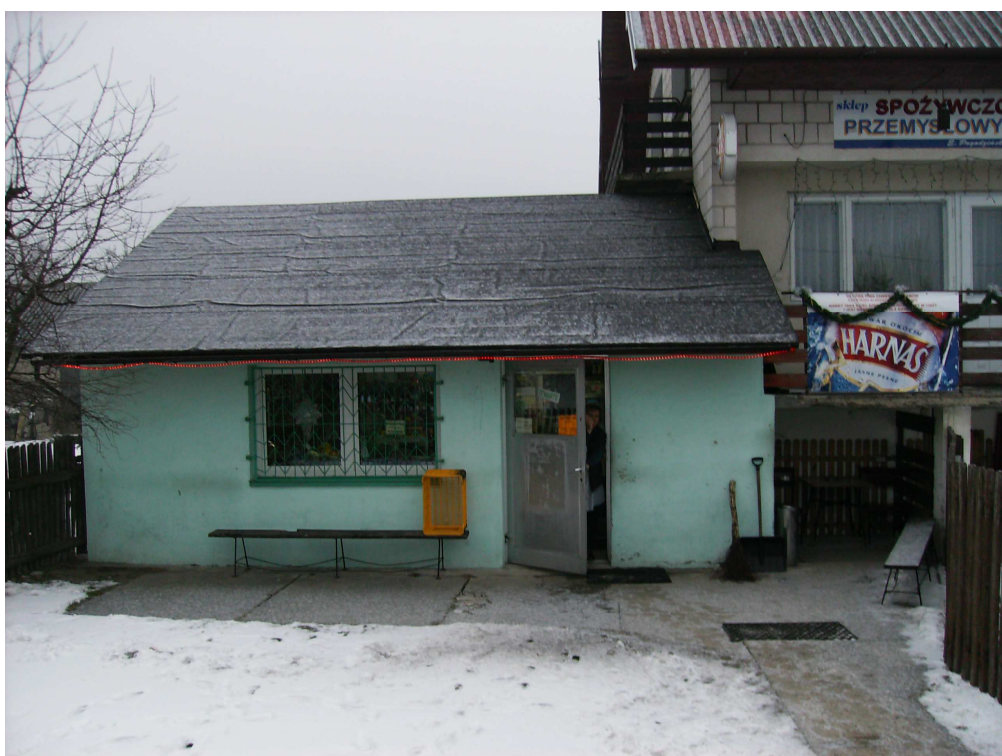
Zdjęcie nr 14. Sklep spożywczo-przemysłowy w Ubyszowie

Budynek ten został wzniesiony przy 30% wkładzie udziału mieszkańców w postaci oddanych gruntów, składek pieniężnych i czynów społecznych.